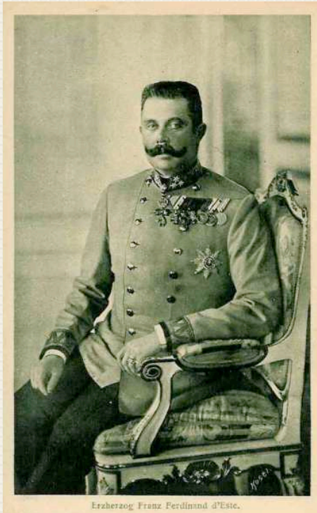
Erzherzog Franz Ferdinand d'Autriche.

passage à la Belgique, neutre. Le 3 août, l'Allemagne envahit la Belgique et déclare la guerre à la France. Le lendemain, c'est au tour de la Grande-Bretagne de déclarer la guerre à l'Allemagne : c'est le début de la Première Guerre Mondiale , qui se voulait courte et qui dura finalement quatre longues années .