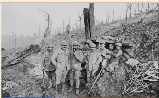
Région de Verdun