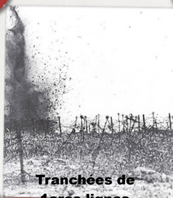
Tranchées de 1 ères lignes