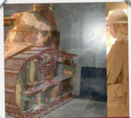
Centre d'interprétation Marne 1914/1918