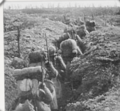
Tranchées de communications